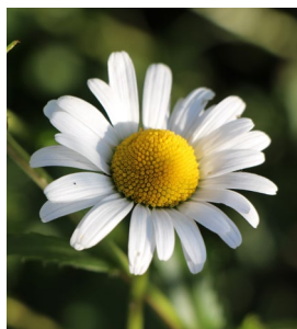
Wiesen-Margerite Blütenkörbchen ca. 5 cm breit, mit breiten weissen Zungenblüten. Un- verzweigte Stängel Einheimisch.