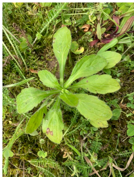
Überwinterung als Rosette