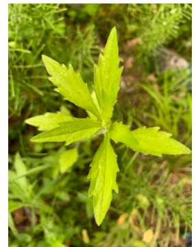
Hellgrüne behaarte Blätter, am Rand grob gezähnt