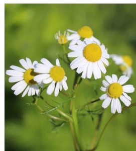
Echte Kamille Geteilte Blätter, breite Zungenblüten, stark aromatisch Einheimisch.