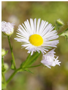
Blütenkörbchen 1–2 cm breit, viele schmale Zungenblüten in weiss bis lila, blüht von Mai bis Oktober