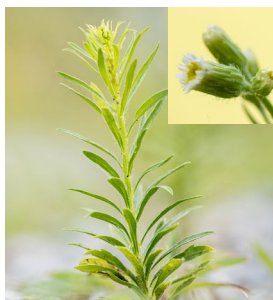
Kanadisches Berufkraut Ein Hauptstängel, rund 100 Blüten, kurze Zungenblüten Ebenfalls ein Neophyt - Bekämpfung empfohlen.