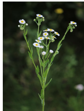
Behaarte Stängel, oben verzweigt, bis 1,5 m hoch